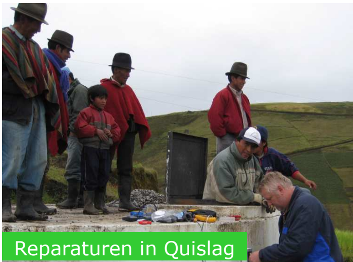
Reparaturen in Quislaq

Als Familie geht es uns gut, dafür sind wir sehr dankbar. Wir bitten um euer Gebet für die finanzielle Situation zur Versorgung der Missionare der Deutschen Missionsgemeinschaft und des Deutschen Mennonitischen Missionskomitees. Wir danken Euch alle herzlich für eure regelmäßige Unterstützung, Interesse und eure Gebete. Wer von euch Zugang zum Internet hat, kann weitere Fotos auf unserem Blog: http://hschirma.blogspot.com finden.